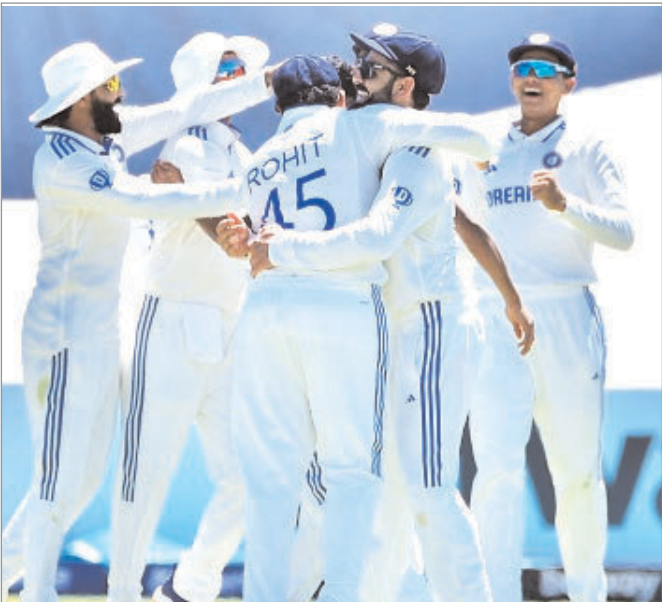
लेकिन रोहित को लगता है कि ब्रिसबेन में मिली जीत भी इतनी ही महत्वपूर्ण

थी क्योंकि 33 साल में ऑस्ट्रेलिया को दौरा करने वाली टीम वहां नहीं हरा सकी थी। रोहित ने कहा, ‘कहीं और मिली टेस्ट जीत से तुलना करना मुश्किल है। इन टेस्ट को रैंकिंग देना मुश्किल है। प्रत्येक टेस्ट मैच की अपनी अहमियत होती है। मुझे लगता है कि गाबा में ऑस्ट्रेलिया पिछली बार 1988 में हारा था। तो यह उनका गढ़ बन गया था और हमने जिस तरह से टेस्ट जीता, वह महत्वपूर्ण था।’ उन्होंने कहा, ‘आप टेस्ट को रैंक नहीं कर सकते। हालांकि यह जीत ऊपर ही होगी। यह दिखाता है कि यह कितना महत्वपूर्ण स्थल है और यह आकर जीतने का श्रेय टीम को जाता है।’ रोहित ने हालांकि घुमा फिराकर कहा कि वह तीन मैच की टेस्ट सीरीज खेलना पंसद करेंगे लेकिन इस झूठ को 2024 की अच्छी शुरूआत कहेंगे। उनसे जब पूछा गया कि क्या तीन मैच