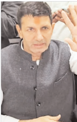
पटवारी ने आगे कहा कि भाजपा

मध्य प्रदेश के कांग्रेस अध्यक्ष जीतू पटवारी ने मुख्यमंत्री मोहन यादव को लेकर एक बड़ा बयान दिया है। पटवारी ने कहा है कि सीएम यादव पूर्व मुख्यमंत्री शिवराज सिंह चौहान से बदला ले रहे हैं। वह पूर्व सीएम द्वारा नियुक्त कलेक्टरों और अधिकारियों को हटा रहे हैं। सीएम यादव की मंशा पर सवाल उठाते हुए कांग्रेस के नए अध्यक्ष ने कहा कि बीजेपी की यह इंटरनल पॉलिटिक्स है।