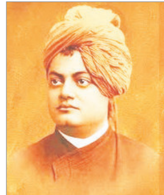
राष्ट्रीय युवा दिवस की शुभकामनाएं

पीएम मोदी ने आज से शुरू किया 11 दिन का विशेष अनुष्ठान