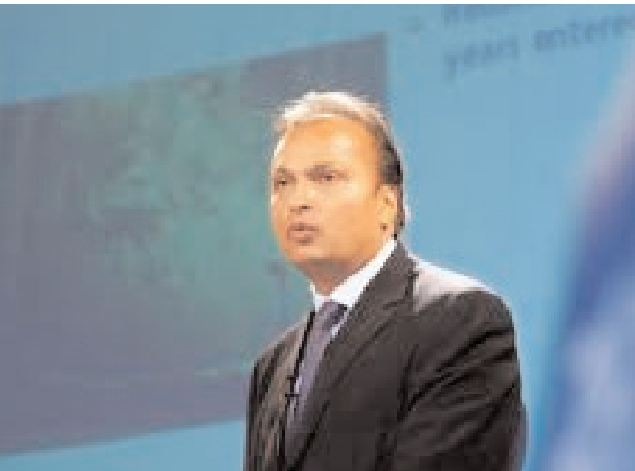
प्लास्टिक, पाइप, इन्फ्रास्ट्रक्चर से संबंधित 8000 करोड़ रुपये की परियोजनाओं की घोषणा की, जो 3000 प्रत्यक्ष और 10,000 अप्रत्यक्ष रोजगार के अवसर पैदा करेंगे। कनाडा से आए इन्वेस्टर एकाग्रता