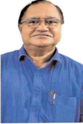
लेखक- सुरेंद्र सिंघल /गौरव सिंघल