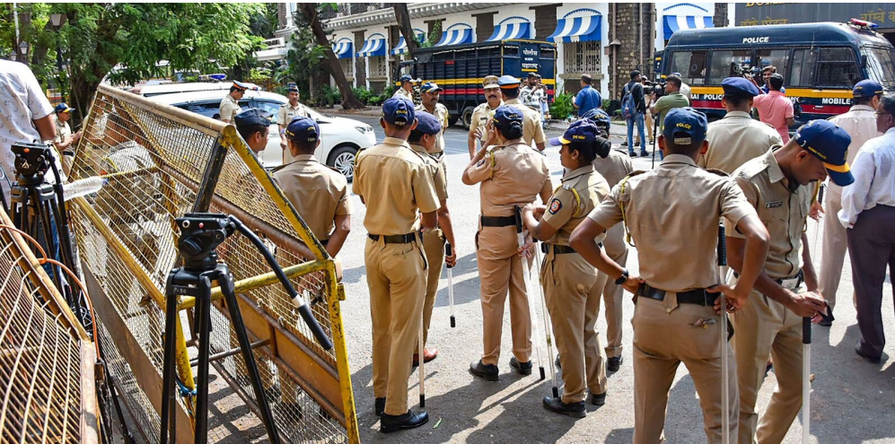
●सिटी चीफ, नई दिल्ली