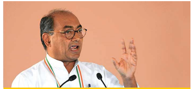
बीजेपी बोली- प्रियंका से करवा लिया दिग्विजय क्यों नहीं कर रहे ट्वीट