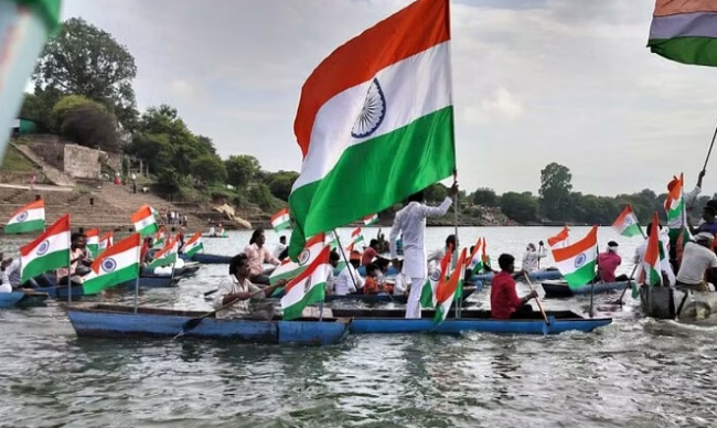
•सिटी चीफ, शाजापुर

जबलपुर, मध्यप्रदेश में स्वतंत्रता दिवस से पहले कई जगह तिरंगा यात्रा निकाली गई। जबलपुर में उफनती नदी में लोग उतरे, गले-गले तक तैरकर हाथों में तिरंगा लेकर लोग निकले। वहीं दमोह के हटा में तिरंगा यात्रा अलग तरीके से निकाली गई। सुनार नदी में से ये यात्रा गुजरी। 20 नावों पर तिरंगा सजा था। तिरंगा यात्रा नावघाट से प्रारंभ होकर घुराघाट पर समाप्त हुई।