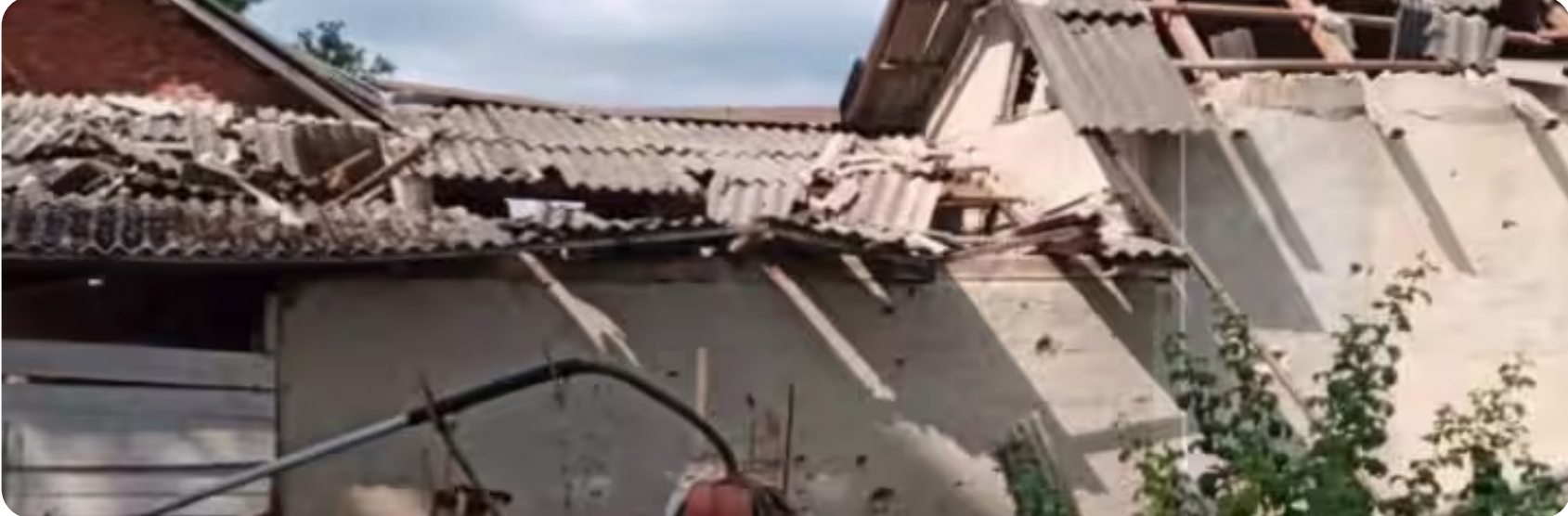
●सिटी चीफ, नई दिल्ली

रूस और यूक्रेन के बीच बीते डेढ़ साल से चल रहा भीषण युद्ध अब भी थमा नहीं है. दोनों तरफ से ताबड़तोड़ हमले जारी है. हाल के दिनों में यूक्रेन ने भी आक्रमक तेवर दिखाए हैं. जिससे रूस बौखलाया हुआ है. रविवार को यूक्रेन के गृह मंत्रालय की तरफ से दी गई जानकारी के अनुसार, रूस ने यूक्रेन के दक्षिणी खेरसाँन क्षेत्र पर मिसाइलों की बरसात की है. जिसमे कुल सात लोगों की मौत हुई है. मृतकों में एक 23 दिन की एक बच्ची भी शामिल है.