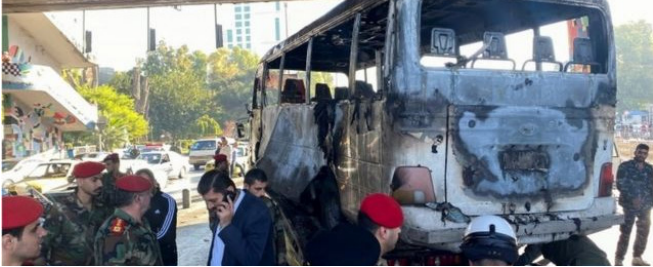
●सिटी चीफ, नई दिल्ली

बेरूत, लेबनान: युद्धग्रस्त देश के पूर्वी हिस्से में सीरियाई सरकारी बलों पर इस्ला-मिक स्टेट समूह के जिहादियों के हमले में 33 सैनिक मारे गए हैं. कल खबर थी कि इस हमले में 26 लोगों की मौत हुई है. जो अब बढ़कर 33 हो गई है. सीरियन ऑब्जर्वेंटरी फॉर ह्यूमन राइट्स के अनुसार, गुरुवार शाम सेना की बस पर हुई गोलीबारी इस साल सरकारी बलों पर चरमपंथी समूह का सबसे घातक हमला था.