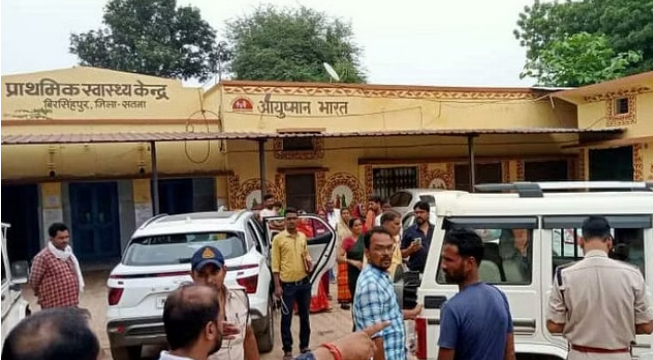
•सिटी चीफ, सतना

सतना, सतना जिले के बिरसिंहपुर तहसील में पदस्थ तहसीलदार की हार्ट अटैक आने से मृत्यु हो गई। वे भारत सरकार द्वारा चलाए जा रहे तिरंगा यात्रा में शामिल हुए थे। जहां तहसीलदार को हार्ट अटैक आया है, आनन-फानन में तहसीलदार को अस्पताल में भर्ती कराया गया। यहां इलाज के दौरान डॉक्टरों ने उन्हें मृत घोषित किया। तहसीलदार ने पांच दिन पहले ही यहां ज्वाइन किया था। तहसीलदार के निधन के बाद प्रशासन ने उनके परिजनों को सूचना दे दी है।