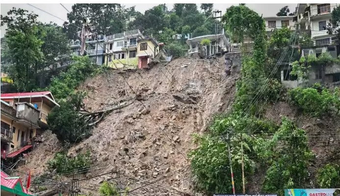
●सिटी चीफ, इन्दौर

भारत मौसम विज्ञान विभाग ने हिमाचल प्रदेश और उत्तराखंड के कई हिस्सों में अगले 24 घंटों में भारी बारिश होने की संभावना जताई है. साथ ही इन इलाकों के लिए 'रेड अलर्ट' भी जारी किया है. पिछले कुछ दिनों से यहां लगातार बारिश हो रही है. जानकारी के मुताबिक दोनों ही राज्यों में बारिश के कारण 65 से अधिक लोगों की मौत हो गई है. दोनों राज्यों में हो रहे भूस्खलन, बाढ़, बादल फटने और भारी बारिश ने कई लोगों की जान ले ली है. संपत्तियों को भी काफी नुकसान पहुंचा है. बारिश और भूस्खलन ने यहां के बुनियादी ढांचे को तहस-नहस कर दिया है.