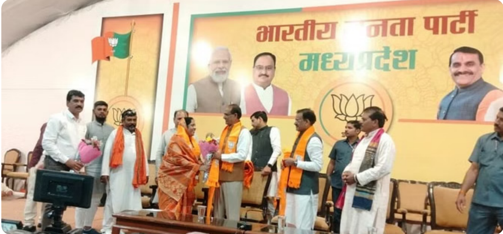
•सिटी चीफ, खंडवा

कांग्रेस ने कहा: बीजेपी को सता रहा हार का दर, इसलिए वह कहीं हमारे नेताओं को तोड़ने का प्रयास कर रही है