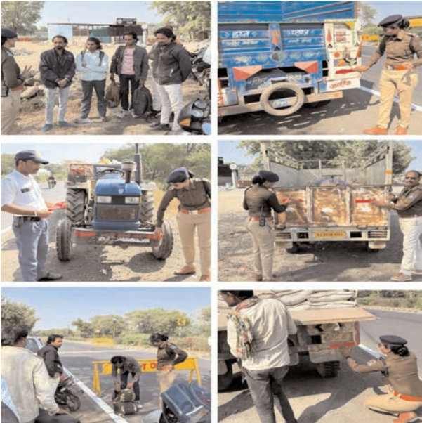
वाहन चलाते समय सीट बेल्ट लगाने, वाहन चलाते समय