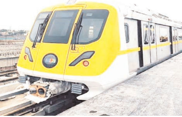
सिटी चीफ इन्दौर

सिटी चीफ इन्दौर इंदौर में नकली डीजल बेचने का मामला सामने आया है। खाद्य विभाग व क्राइम ब्रांच ने संयुक्त कार्रवाई करते हुए तीन इमली चौराहे स्थित पेट्रोल पंप पर छापा मारकर नकली डीजल पकड़ा। अधिकारियों के अनुसार, उक्त पेट्रोल पंप से कैमिकल युक्त नकली डीजल बेचने की सूचना मिली थी। पीथमपुर से टैंकर के द्वारा नकली डीजल की सप्लाई की जाती थी। खबरों के अनुसार पीथमपुर से इंदौर शहर, मद्हू, राऊ, उज्जैन, के अलावा प्रदेश से बाहर भी कैमिकल युक्त यह डीजल