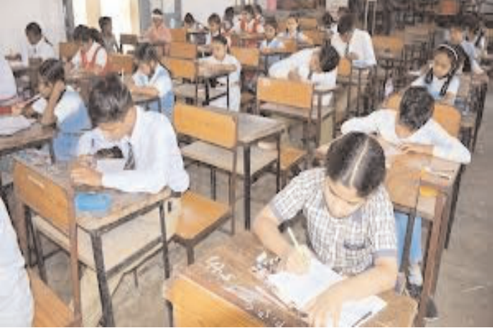
शामिल होंगे। तीन से पांच किमी के दायरे में परीक्षा केंद्र चुने जाएंगे, ताकि

परीक्षाओं की तैयारी एमपी बोर्ड ने शुरू कर दी है। जिन स्कूलों में मूलभूत सुविधाओं का अभाव है वहां परीक्षा केन्द्र नहीं बनाया जाएगा सभी परीक्षा केंद्रों पर बेंच व डेस्क की उपलब्धता आवश्यक है। तभी उसे परीक्षा केंद्र बनाया जाएगा। सेंटर बनाने के लिए स्कूलों में पानी, बिजली, फर्नीचर, शौचालय की व्यवस्था अनिवार्य किया गया है। इस संबंध में राज्य शिक्षा केंद्र ने दिशा-निर्देश जारी किए हैं। प्रदेश के पांचवीं व आठवीं की बोर्ड परीक्षा 24 फरवरी से कराने के लिए तैयारी जोरों पर है। प्रदेश भर में सरकारी व निजी स्कूलों के करीब 24 लाख विद्यार्थी परीक्षा में