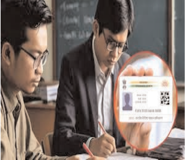
कॉलेजों में पहले से आधार बेस्ड बायोमेट्रिक अटेंडेंस सिस्टम लागू है।

भोपाल। शैक्षणिक सत्र 2025-26 से आयुर्वेद, यूनानी और सिद्धा कॉलेजों की मान्यता के लिए फैकल्टी की आधार के माध्यम से उपस्थिति ही मान्य की जाएगी। कॉलेज में उपस्थिति दर्ज करते ही भारतीय चिकित्सा पद्धति राष्ट्रीय आयोग (एनसीआइएसएम) में उपस्थिति लग जाएगी। कॉलेजों की मान्यता के दौरान यही उपस्थिति मान्य की जाएगी। चाहे वह नया कॉलेज प्रारंभ करने के लिए हो या फिर सीटों में वृद्धि के लिए। ऐसे फैकल्टी जो सिर्फ निरीक्षण के समय दिखते हैं, बाकी दिनों में उनकी उपस्थिति के प्रमाण नहीं मिले तो उसका टीचर कोड एक वर्ष के लिए वापस ले लिया जाएगा। यानी, वह एक वर्ष तक किसी कॉलेज में सेवा नहीं दे पाएंगे। जिस कॉलेज को ऐसे फैकल्टी पाए जाएंगे उस पर 25 लाख रुपये का अर्थदंड भी लगाया जाएगा। बता दें, एलोपैथी मेडिकल