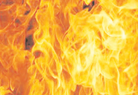
फायर ब्रिगेड और 100 फायरफाइटर्स को तैनात किया गया था। मीडिया रिपोर्ट में प्रवक्ता के हवाले से कहा गया है, अग्निशमन अभियान दो घंटे से अधिक समय तक चला, अंततः आग बुझाने में सफलता मिली।