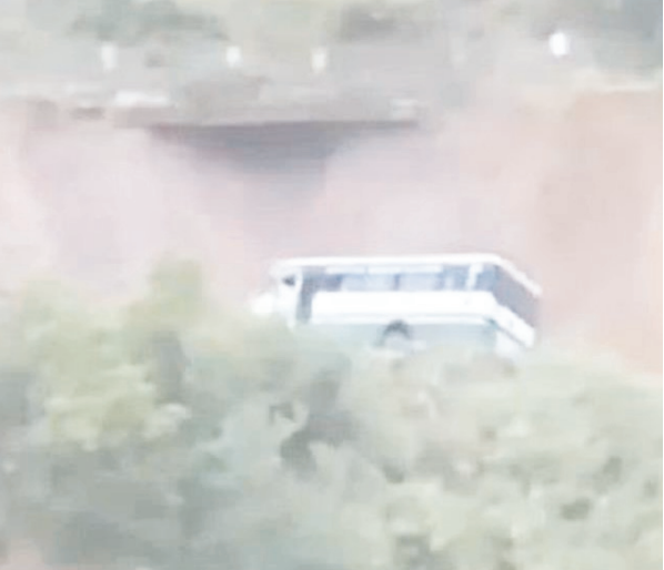
घायल यात्रियों को निकाला। घायलों को हरिपुर जिले के एक

पेशावर= उत्तर पश्चिमी पाकिस्तान के खैबर पख्तूनख्वा में मंगलवार देर रात एक तेज रफ्तार बस के खाई में गिर जाने से कम से कम 10 लोगों की मौत हो गई और 15 अन्य घायल हो गए। पुलिस ने बुधवार को यह जानकारी दी। बस हरिपुर जिले के खानपुर से एक पहाड़ी गांव की ओर जा रही थी, तभी तरनावा में दुर्घटनाग्रस्त हो गई। पुलिस ने बताया कि तेज गति के कारण एक मोड़ पर चालक ने वाहन पर से नियंत्रण खो दिया और बस गहरी खाई में गिर गई। मृतकों में पुरुष, महिलाएं और बच्चे शामिल हैं। बचाव वाहन दुर्घटनास्थल पर पहुंचे और स्थानीय लोगों की मदद से