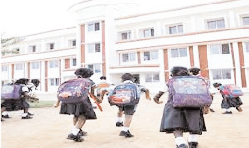
माध्यमिक स्कूलों की मान्यता नियम 2017 (संशोधित नियम 2020) इसमें यह उल्लेखित है कि 10वीं तक के स्कूल चार हजार स्क्वायर फीट क्षेत्र में हो ना चाहिए तो 12वीं तक के स्कूल 5600 स्क्वायर फीट के क्षेत्र में होना चाहिए। साथ ही जमीन का पंजीयन और लाइसेंस संबंधी दस्तावेज होना चाहिए। विभाग के अधिकारियों की लापरवाही के कारण वर्षों से ये स्कूल बिना कागजों के चल रहे हैं। इन स्कूलों के पास ना तो पर्याप्त कमरे हैं और ना ही मान्यता नियमों का पालन कर रहे हैं। इनके पास जमीन का पंजीयन

सिटी चीफ भोपाल। 2017 के मान्यता नियमों का पालन नहीं कर रहे हैं भोपाल। स्कूल शिक्षा विभाग के अधिकारियों की लापरवाही के कारण भोपाल संभाग के करीब 30 निजी स्कूलों की मान्यता को अमान्य कर दिया गया है। अब इन स्कूलों को मान्यता नवीनीकरण के लिए फिर से अपील करना होगा। वहीं प्रदेश भर में कई स्कूलों की मान्यता समाप्त हो चुकी है। फिर भी स्कूल संचालित हो रहे हैं। इसमें भोपाल जिले के भेल क्षेत्र के छह निजी स्कूलों की मान्यता संबंधी मामला स्कूल शिक्षा विभाग के पास पहुंचा था। ये स्कूल करीब 40 सालों से बिना दस्तावेज और लाइसेंस के चल रहे हैं और 2017 के मान्यता नियमों का पालन नहीं कर रहे हैं। इसमें से दो स्कूलों ने भेल से 2027 तक का लाइसेंस लेकर दस्तावेज जमा कर दिए हैं, लेकिन चार स्कूलों के पास कोई जमीन का पंजीयन,भेल से प्राप्त लाइसेंस, सहित अन्य दस्तावेज नहीं है।इन स्कूलों की मान्यता भी समाप्त हो चुकी है। ये चारों स्कूल भेल क्षेत्र के गोविंदापुरा में स्थित है। इसमें नेहरू बाल भारती उमावि, न्यू सरस्वती विद्या मंदिर उमावि,डा. राममनोहर लोहिया हाईस्कूल,जयहिंद उमावि शामिल है। इन स्कूलों में करीब ढाई हजार विद्यार्थी अध्ययनरत हैं। अब ये स्कूल बंद होने के कगार पर हैं। माध्यमिक एवं उच्चतर