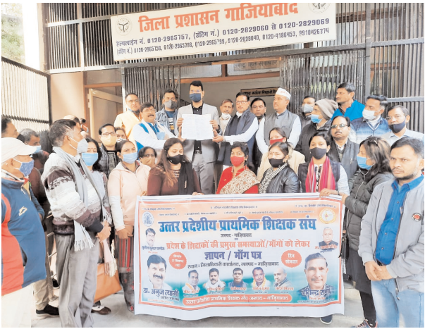
प्राध्यापक एवं प्राचार्य के पद पर पदोन्नति प्रक्रिया प्रारंभ की जा सकेगी। सरकार के इस कदम का प्रदेश के शिक्षकों ने स्वागत किया है। प्रान्तीय शासकीय

सिटी चीफ भोपाल। सोमवार को आयोजित मंत्री परिषद की बैठक में प्रदेश के उच्च शिक्षा विभाग में कार्यरत प्राध्यापकों को छोटे यूजीसी वेतनमान में एजीपी 10 हजार रुपए स्वीकृत किये जाने के प्रस्ताव के अनुमोदन से शिक्षकों में खुशी की लहर है। इस निर्णय से प्राध्यापकों की एक दशक से अधिक से समय से लम्बित मांग का निराकरण हो गया है। शासन के इस कदम से प्रदेश के प्राध्यापक अब देश के अन्य राज्यों के प्राध्यापकों के समान एजीपी 10 हजार का वेतनमान प्राप्त करेंगे तथा महाविद्यालय के प्राध्यापकों को भी अब कुलपति नियुक्त किया जा सकेगा। इसके अतिरिक्त महाविधालयीन शिक्षकों के