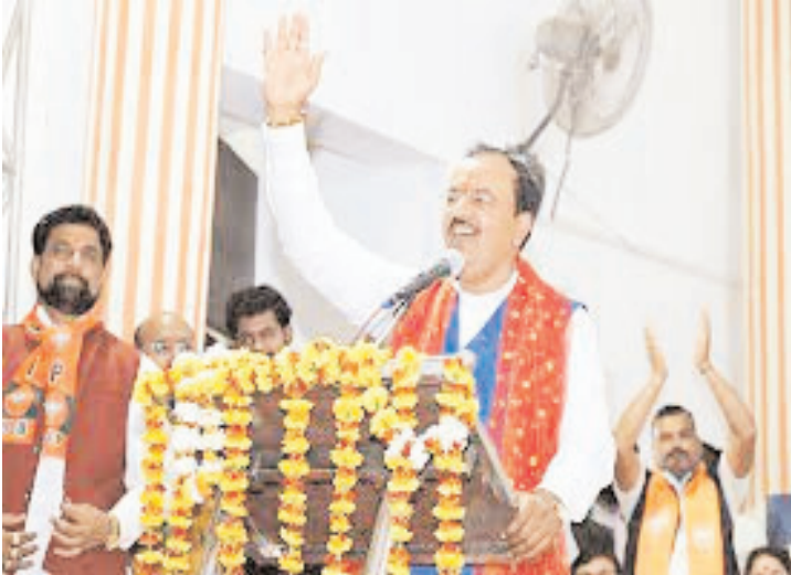
प्रधानमंत्री नरेंद्र मोदी के नेतृत्व में भाजपा सरकार सबका साथ, सबका विकास, सबका विश्वास और सबका प्रयास से कार्य कर रही है। 22 जनवरी को देश और

सिटी चीफ भोपाल। जिन्होंने अयोध्या में प्रभु श्रीरामलला की प्राण-प्रतिष्ठा का निमंत्रण ठुकराया है, उन्हें लोकसभा चुनाव में देश और प्रदेश की जनता ठुकरा देगी। पीएम मोदी की गरीब कल्याण की योजनाओं ने लोगों का जीवन बदलने का कार्य किया है। मध्य प्रदेश के विधानसभा चुनाव में भाजपा को प्रचंड जीत मिली है। इस लोकसभा चुनाव में भी पार्टी को प्रदेश की सभी 29 लोकसभा सीटों पर ऐतिहासिक विजय मिलना तय है। पार्टी के प्रत्याशी को ऐतिहासिक विजय दिलाने के लिए कार्यकर्ता चुनाव कार्य में जुट जाएं। यह बात उत्तर प्रदेश के उप मुख्यमंत्री केशव प्रसाद मौर्य ने सतना के टाउन हॉल और रीवा जिला कार्यालय के सामने स्थित मैदान में लोकसभा कार्यकर्ता सम्मेलन को संबोधित करते हुए कही। मौर्य ने कहा कि