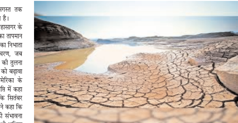
12 साल में पहली बार होगा ऐसा...

महासागर में भी कम से कम अगस्त तक स्थितियां 'तटस्थ' रहने की संभावना है। क्या है मौसम की स्थिति? प्रशांत महासागर के साथ-साथ हिंद महासागर में सतह का तापमान भारत के मानसून में एक प्रमुख भूमिका निभाता है। महासागर का 'सकारात्मक' चरण, जब पश्चिमी हिंद महासागर का पानी पूर्व की तुलना में गर्म होता है, आम तौर पर बारिश को बढ़ावा देता है। प्रशांत क्षेत्र के लिए, अमेरिका के जलवायु पूर्वानुमान केंद्र ने एक विज्ञप्ति में कहा कि 50ब से अधिक संभावना है कि सितंबर तक तटस्थ स्थितियां बनी रहेंगी। इसने कहा कि वर्ष के अंत तक इसके बने रहने की संभावना ला नीना या एल नीनो की तुलना में भी अधिक है।